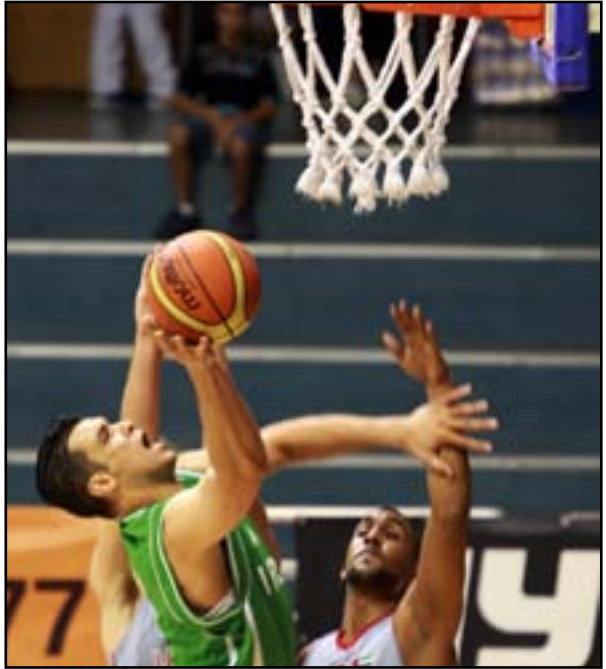
منتخبنا السلوي يسعى لمعالجة كيوته في غرب آسيا