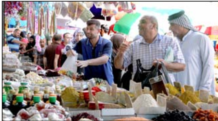
بغداديون يتبعون في سوق الشورجة وسط العاصمة بغداد، استعداداً لاستقبال شهر رمضان..

وقال انطون في حديث لـ "المدى"، في ظل نظام اقتصاد السوق لايمكن أن تجري عملية تسعيرة