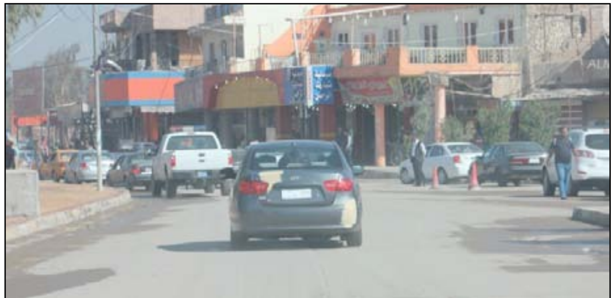
لحد شوارع مدينة بعقوبة مركز محافظة ديالى

دعا مجلس محافظة ديالى، أمس الاثنين، الدوائر الخدمية في المحافظة لرفع مستوى الخدمات المقدمة للمواطنين، وفيما اشار الى اهمية تفعيل الدور الأمني لمواطني المحافظة، طالب بتوزيع مقرّات دوائر المحافظة بعيداً عن مركز المدينة.