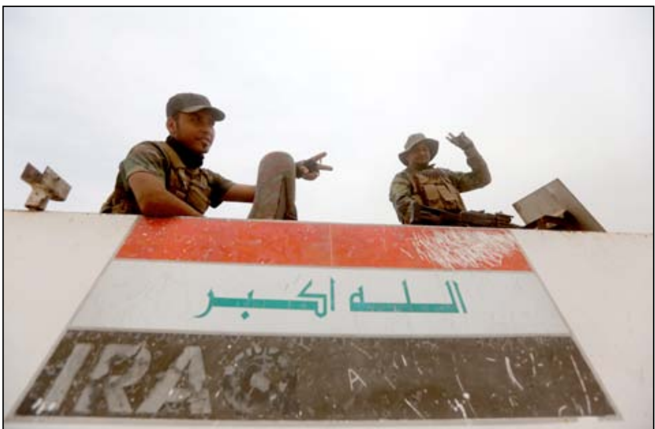
أفراد من الجيش في صلاح الدين...