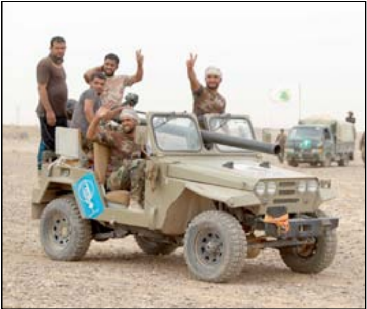
ألية عسكرية في بييجي.

وأضاف "التصدي للمتطرف ومواجهة العنف الطائفي سيطلب المزيد من العمل