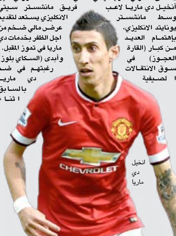
انخيل دي ماريا

الجدير بالذكر ان مانشستر سيتي يواجه صراعا ثلاثيا مع برشلونة الإسباني وبارن ميونخ الألماني وباريس سان جيرمان الفرنسي، من أجل الظفر بخدمات دي ماريا في الصيف.