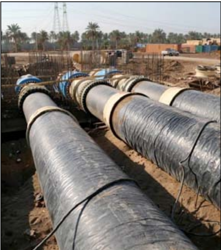
مشروع ماء الرصافة الكبير