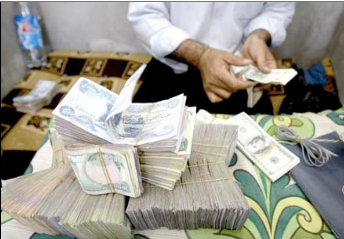
السوق المحلية تشهد ارتفاعا كبيرا لاسعار صرف الدولار

عدت اللجنة المالية في مجلس النواب العراقي، أمس الإثنين، أن العديد من علامات الاستفهام تثار بشأن نتائج إجراءات البنك المركزي العراقي لوقف تدهور قيمة الدينار مقابل الدولار، في حين رأت لجنة الاقتصاد والاستثمار النيابية أن حل العديد من الأزمات الاقتصادية يكمن بتعديل قانون ذلك البنك بما يؤمن استقلاله عن الحكومة، وحمل صرافون "تعسف البنك المركزي مسؤولية ارتفاع الدولار، برغم نفي الأخير ذلك واتهامه إياهم والمضاربين بمسؤوليتهم في ارتفاع سعر صرف الدولار، وتوعدهم بإجراءات "رادعة"