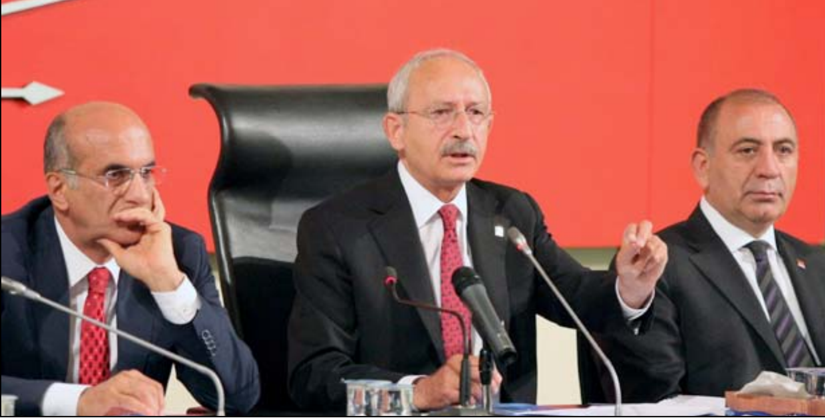
كمال قليجدار أوغلو رئيس حزب الشعب الجمهوري في مؤتمر صحفي

من جانبه، لوح اردوغان باللجوء إلى الانتخابات المبكرة، وقال إنها ستكون «حتمية»، إذا لم يتمكن