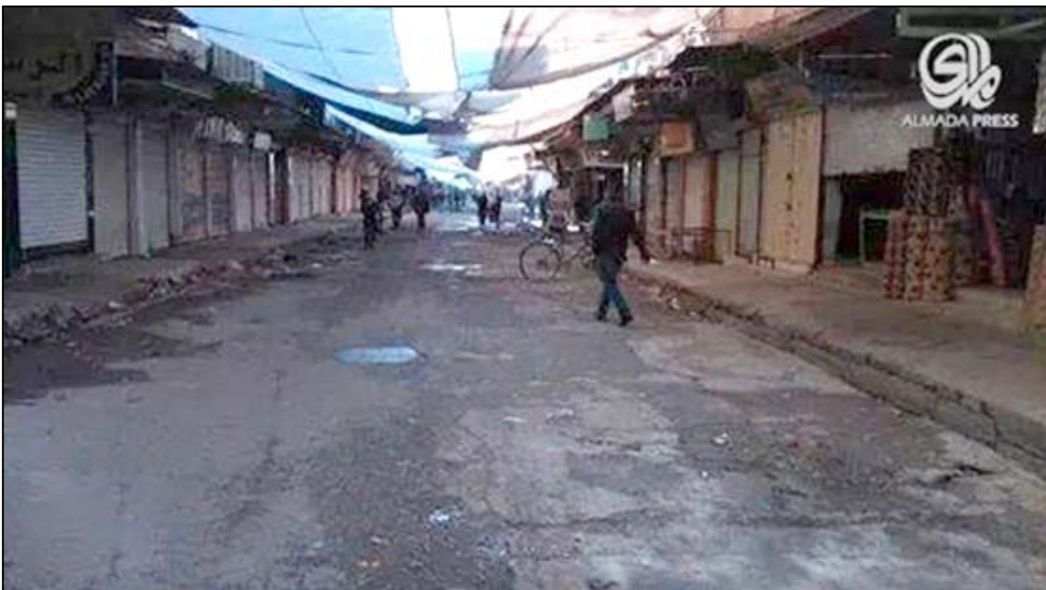
(داعش) يغلط المحال في سوق النبي يونس، شرقي الموصل.

يعاني سكان الموصل بمحافظة نينوى تناقصا حاداً في المواد والبضائع الاساسية من الاسواق، وفيما اشاروا إلى ان هذه المواد بدأت تقل تدريجياً من الاسواق والمحال مع خشيتهم ان يصل الموضوع للمواد الطبية في المستشفيات والصيدليات، ويؤكد تجار إغلاق الطرق الرئيسية البرية المؤدية الى الموصل، بسبب العمليات العسكرية والإجراءات الامنية مما زاد من تخوف الاهالي من هذا الحصار.