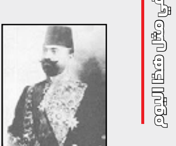
وفاة طالب النقيب