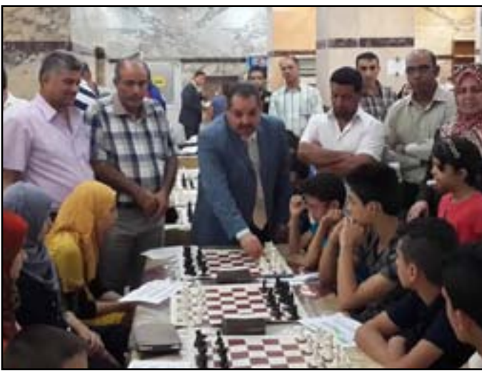
نجاح اتحاد الشطرنج في اسدال الستار عن بطولة الناشئين

وأوضح : أفرزت البطولة عن بروز لاعبين مهمين للمنتخب الوطني الذي ينتظره عدد من المشاركات سواء كانت على المستوى العربي أو الآسيوي حيث سيجالو الاتحاد جهد إمكانه المشاركة في البطولات على الصعيد القاري بالرغم من تقليص الميزانية المرصودة للاتحاد .