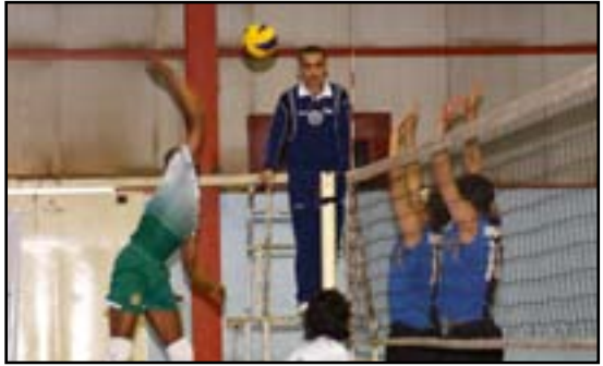
طائرة الناشئين تتسكّر في البحرين

الحالي. واضاف: بعد الانتهاء من المعسكر الخارجي سيتم اقامة معسكر داخلي لغرض التحضير النهائي للبطولة