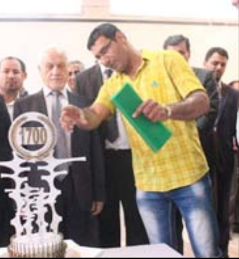
معرض يضم نماذج من التصاميم المشاركة في مسابقة النصب التذكاري لتخليد ضحايا مجزرة سبايكر

كشف وزير التعليم العالي والبحث العلمي حسين الشهرستاني، أمس الاثنين، عن وجود ٧٠٠ ألف طالب في الجامعات العراقية، وفيما أكد أن هذا العدد قليل قياساً بنسبة سكان العراق، أشار إلى أن الوزارة تعمل بالتنسيق مع أمانة بغداد لوضع النصب التذكارية في ساحات المدن العراقية. وقال الشهرستاني في رده على سؤال لمراسل (المدى برس) خلال مؤتمر صحفي عقده في كلية الفنون الجميلة ببغداد، إن "عدد الطلبة في الجامعات العراقية يبلغ ٧٠٠ ألف طالب في الدراسات الأولية والعليا، مؤكداً ان "هذا العدد قليل مقارنة بنسبة عدد سكان العراق والوزارة تسعى إلى زيادة القبول من خلال افتتاح جامعات جديدة او من خلال توسعة المقاعد الدراسية في الجامعات القديمة". وأضاف الشهرستاني أن "خطة الوزارة هي افتتاح وأستحداث جامعات وكليات جديدة في الإختصاصات الطبية لسد النقص الكبير بالكوادر الطبية في العراق والهندسية والمهنية الفنية لإستغلال ثروات البلد"، مبيناً أن "العراق ما زال بحاجة ماسة إلى افتتاح جامعات جديدة و الأيام المقبلة إعادة افتتاح جامعتي الانبار والتربية والتربية، مشيراً الى ان "الوزارة لن تسمح بقبول الطلبة في اي جامعة أهلية أو حكومية لا تتوفر بها تلك