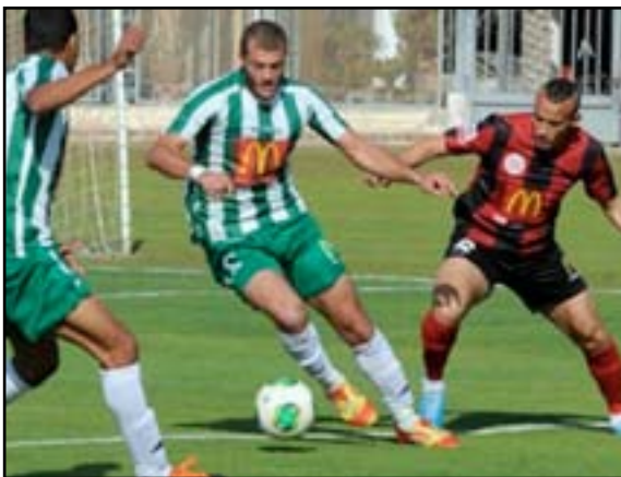
الإنتاج الحربي ال دوري الأضواء من جديد

هذا الموسم من أجل تقليص عدد أندية المسابقة إلى 18 بدلا من 20. وهبط بالفعل الأسيوطي وألعاب دمنهور للدرجة الثانية بعد موسم متتاليين من إلغاء الدوري قبل أن يهبط للدرجة الثانية عقب نهاية الموسم الماضي 2013-2014.