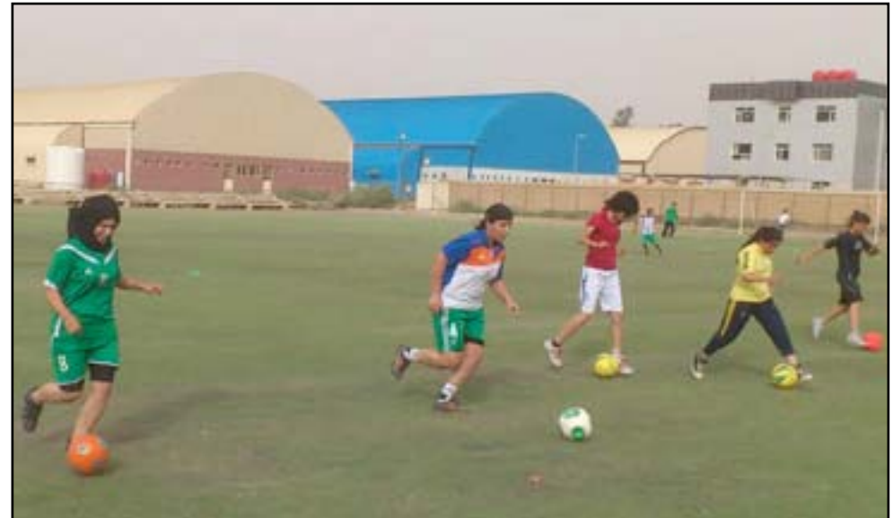
جانب من الوحدة التدريبية لكرة السيدات

واضاف: التدريبات ستستمر لأيام عدة وذلك تحضيراً للاستحقاقات المقبلة التي تنتظر منتخبنا الوطني النسوي إن كانت على الصعيد العربي أو القاري، ونأمل ان يكون هناك تغيير جذري في واقع الكرة النسوية بعد ان شهدت الفترة السابقة إخفاقة كبيرة نسعى لتعويضها في البطولات المقبلة.