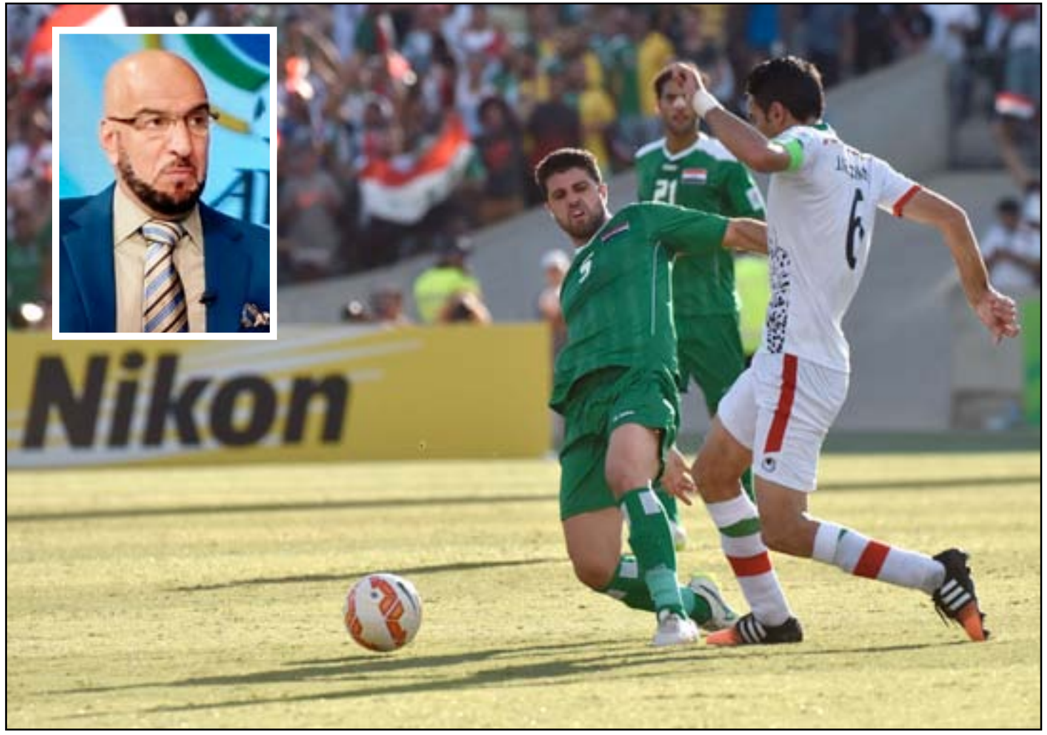
المنتخب الوطني بحاجة الى اصلاحات الى طريقة لعبه