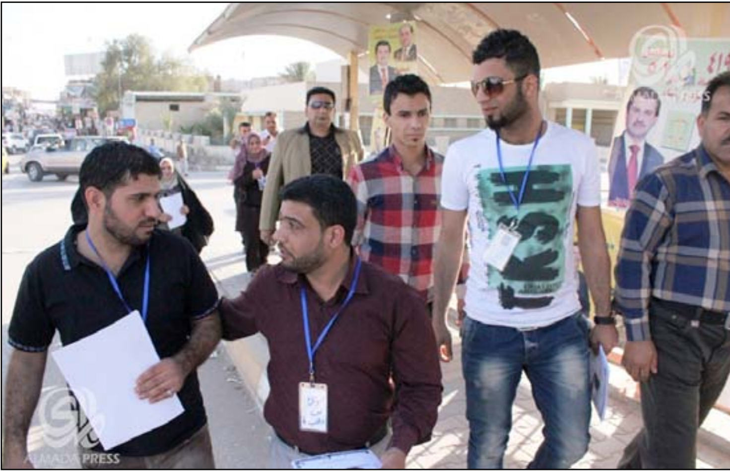
حملة شبابية سابقة تطالب بتوفير الوظائف للخريجين الجدد... أرشيف

بالدولة، حيث لا يمكن تعيين أي طالب يتخرج خاصة إذا ما علمنا وجود الكثير من الكليات الاهلية، إضافة إلى الحكومية". سامي اضاف في تصريح لـ "المدى" ان "الحكومة يجب ان توفر وظائف اخرى بالامكان الاستفادة منها للطلاب المتخرجين، بدلاً من ابقائهم في طوابير الانتظار لأن من المستحيل ان تتحصل وزارات الدولة كل هذا الكم من المتخرجين سنوياً". وكان وزير العمل والشؤون الاجتماعية محمد شياع السوداني، اعلن في وقت سابق، عن ان نسبة البطالة في البلد تجاوزت الـ ٢٥ بالمئة. يذكر أن التجمع الذي يطالب بحقوق الخريجين انطلق في شهر آذار من العام الحالي بمجموعة من الشباب للمطالبة بحقوقهم، وقاموا بتشكيل مجموعة "أريد أتعين... ماعندي واسطة" على موقع التواصل الاجتماعي الفيسبوك ليصل العدد إلى أكثر من ٤٠ ألفاً ضم عدداً من الخريجين لجميع