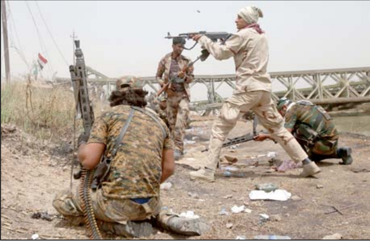
مقاتلو الحشد الشعبي في الانبار..