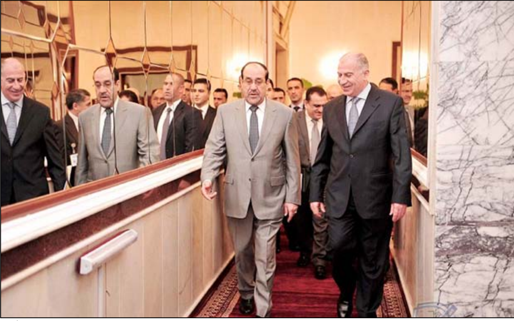
الملك والنقيب في لقاء سابق... أرشيف

من قبل جميع اعضاء اللجنة". ودعا رئيس اللجنة التحقيقية إلى "التعاون مع اللجنة وارسال الاجوبية التحريية لتضمينها في التقرير النهائي"، متوعدا بـ "ادراج اسماء